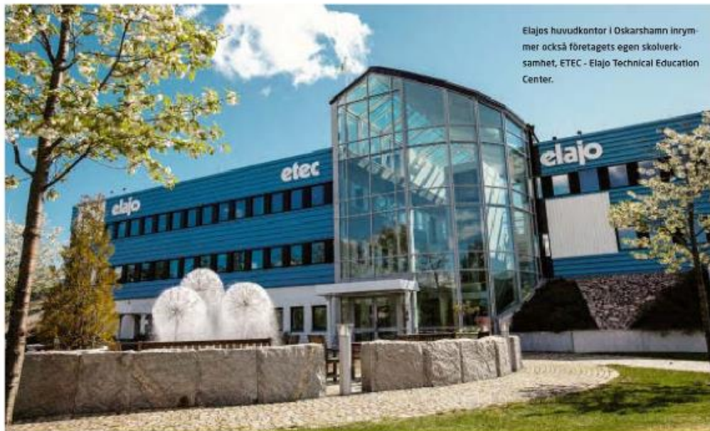
Elajos huvudkontor i Oskarshamn inrymmer också företagets egen skolerksamhet, ETEC - Elajo Technical Education Center.