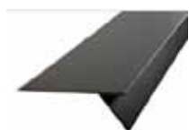
Takfotsplåten som vi använder.

Problemet med takkonstruktionen löste vi via Plannja, som är leverantören av plåttaket. De hade en takfotsplåt till sitt plåttak som vi utgick ifrån, utökade måttet på den del som ligger ner mot hängrännan så att vi fick en snygg lösning och en bra konstruktionslösning på den luftspalt som måste finnas kvar.