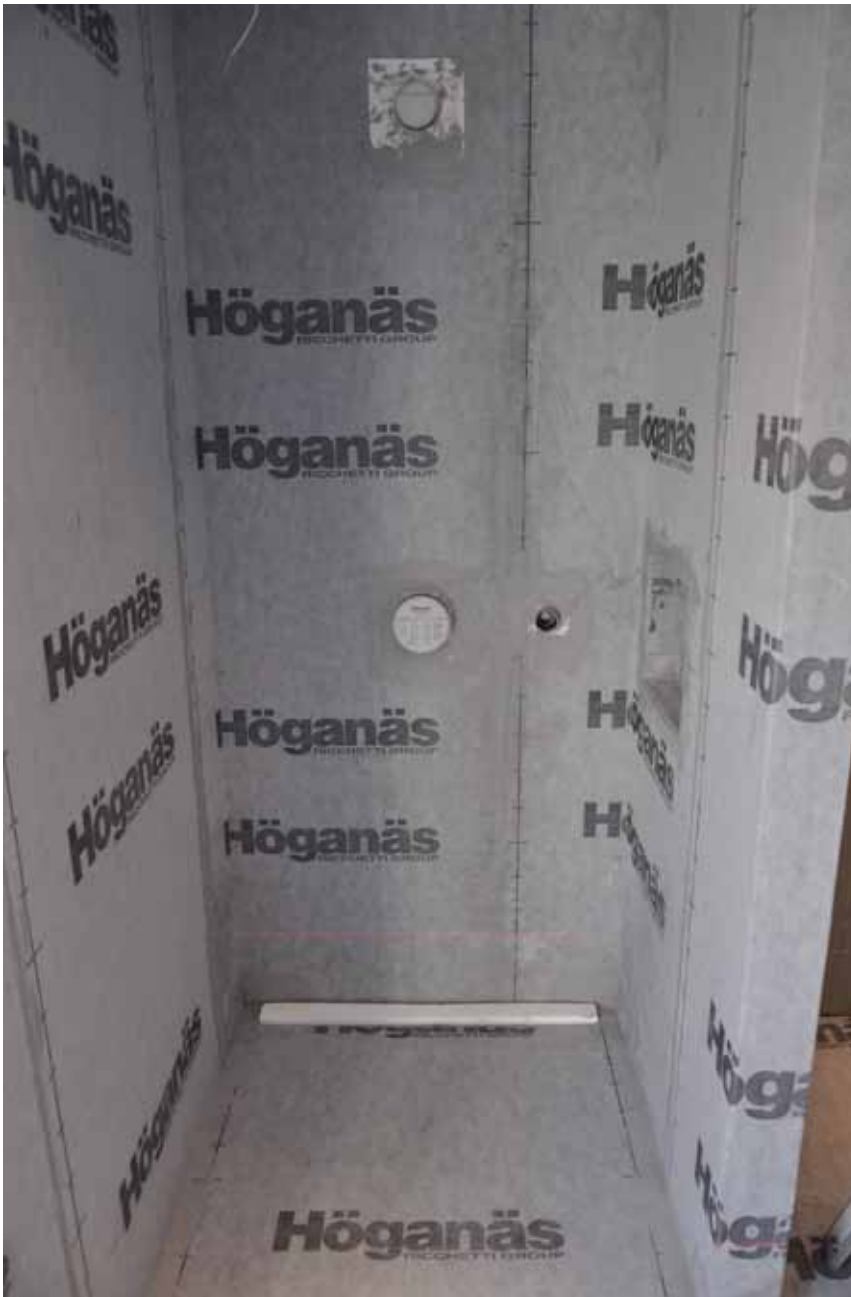
I denna bild är även golvet tätskickt lagt. Samtliga rörutgångar och annan utrustning som kommer sticka ut från klinker förses med ytterligare manchetter för att säkerställa tätheten. Likaså alla ytter- och innerhörn.