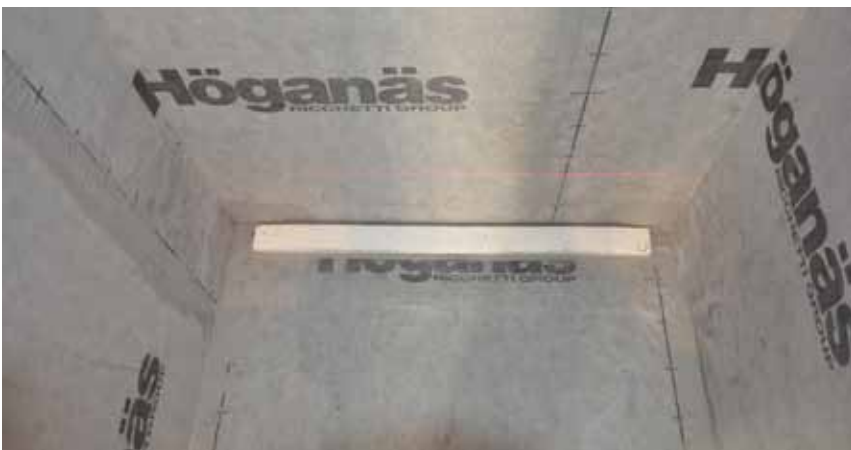
Här ses den färdigmonterade väggnära golvbrunnen. Monterad helt efter tillverkarens anvisningar.