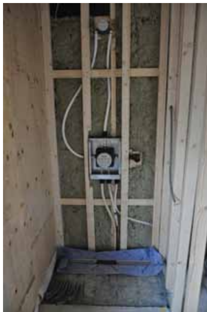
Dert är inte bara golvbrunnar som ska vara täta. Alla vattendetaljer placeras i vattentäta boxar.

Därefter följde flyspackling, som sedan efterföljs av att man tätskicktar utrymmet. Vi valde Höganäs tätskickat. Det innebär kortfattat att man belägger alla ytor med tätskickat för att det vatten som bildas inte ska hamna någon annanstans än i golvbrunnen. Vattenskadornas tid ska vara förbi!