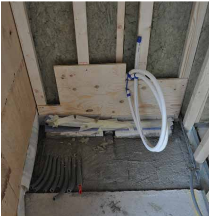
Till vänster passerar elslangen under golvbrunnen. Jag kunde senare låta golvvärmeslingorna passera brunnen.

Inledningsvis gällde det att förbereda för golvvärmeslingornas passage. Det löste jag med elslang. Sen ska dessutom brunnen placeras rätt i förhållande till färdig vägg och färdigt golv. För att överhuvudtaget lyckas hade vi väntat med att gjuta plattan ända upp i duschutrymmet. Det gav mig det utrymme jag behövde.