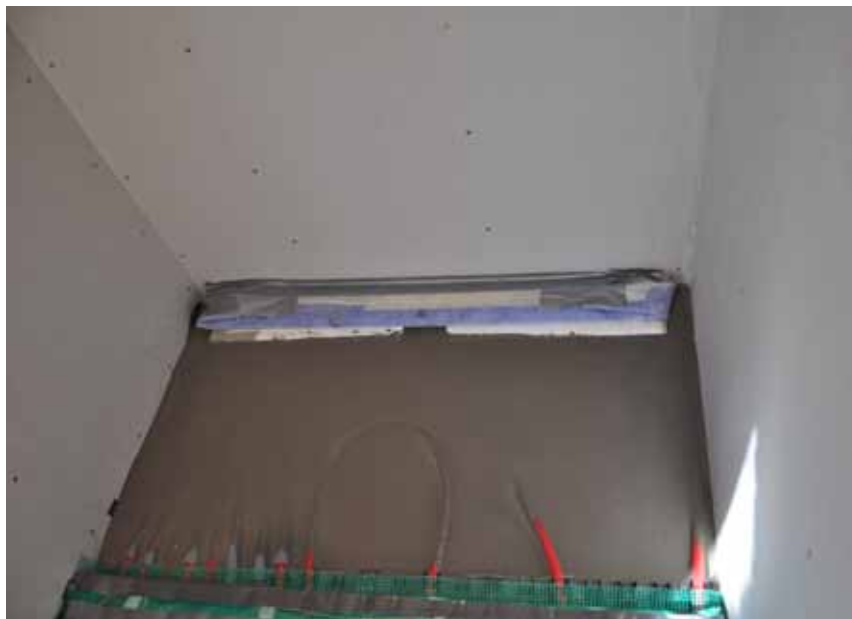
Här har flytspacklingen påbörjats och ska så småningom följas av att tätskickat ska monteras. Tack vare I-Drains förmonterade tätskickat blir förut-sättningarna för ett lyckat resultat så mycket lättare.