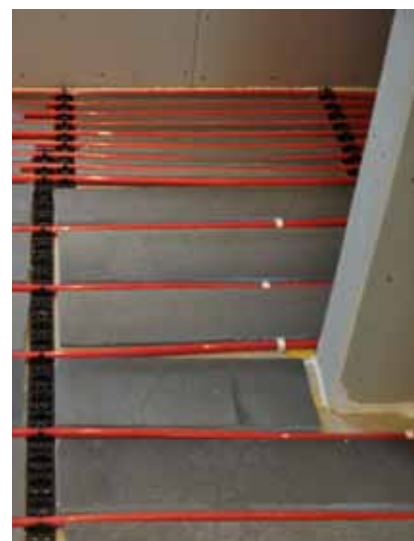
Här är golvvärmeslingorna lagda in mot duschutrymmet.